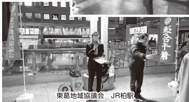
東葛地域協議会 JR柏駅