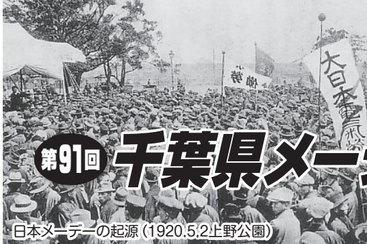
日本メーデーの起源 (1920.5.2上野公園)