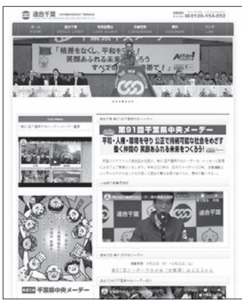
連合千葉HPで公開中

スローガン メーデー100年 平和・人権・環境を守り公正で持続可能な社会をめざす 働く仲間の笑顔あふれる未来をつくろう!