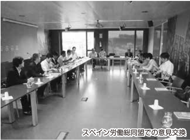
スペイン労働総同盟での意見交換

政府は、歳出削減と労働者の賃金を減らすことで欧州中央銀行(ECB)からの追加支援を受けることで債務危機を乗り切ろうとしています。さらに政府は労働改革にも着手しはじめ、30年間積み上げてきた事が無になりつつあるといえます。これに対して労働組合は、経済が悪化する以前からモノづくりだけでなく、バイオなどの研究開発に力を入れ雇用創出のための政策提言をしたが、政府も国民も聞く耳を持たなかったそうです。現在は失業とインフレの同時進行で大きなジレンマを抱えています。