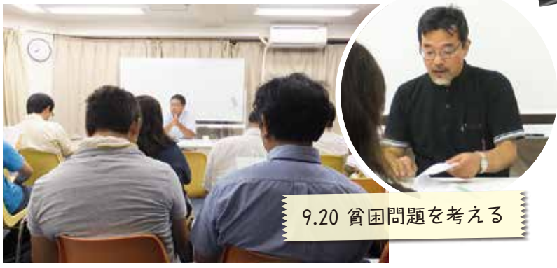
9.20 貧困問題を考える