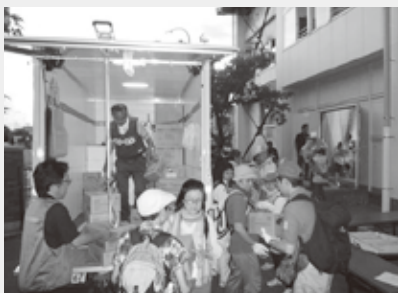
ちばコープは医薬品等の輸送(左)と避難所への物資搬送訓練(右)に参加