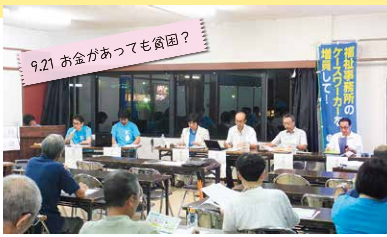
9.21 お金があっても貧困？