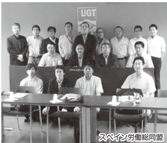
スペイン労働総同盟

次に訪れたのがスペインで最も大きい組合であるスペイン労働総同盟(UGT)で、日本の連合にあたります。さまざまな業種で構成され、カタルーニャ州の構成組合員数は約13万人になります。スペインは欧州では最も失業率が高い国の一つで、失業率は全体で24%と過去最高の水準で推移、若年層に至っては50%にのぼります。ここまで雇用環境が悪化した背景は、ユーロの導入による不動産バブルの影響が大きく、失業率も今年中に25%を超えるだろうと話していました。そのためスペイン