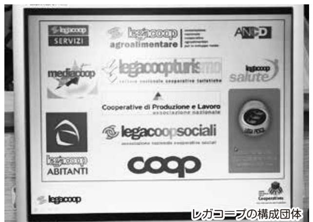
レガコープの構成団体

は1800年代に発足し、20の州にそれぞれ本部があり、従業員数は47万にのぼります。この経済危機においても失業が増える中、協同組合組織だけは例外であったといえます。イタリアでは協同組合に社会的機能が憲法上でも認められ、協同組合運動と協同組合法制が相互に発展してきた特徴があります。法律によれば協同組合は社会的弱者を全体の30%以上雇用すれば、税制優遇が受けられ、社会保険料の免除が行われます。また、破綻した企業を国からの基金で従業員がその所有権を買い取り、労働者協同組合に転換することによ