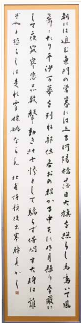
渋味のある調和体作品。十分に紙面に墨量を加え慎重に運筆して重厚味を出した。