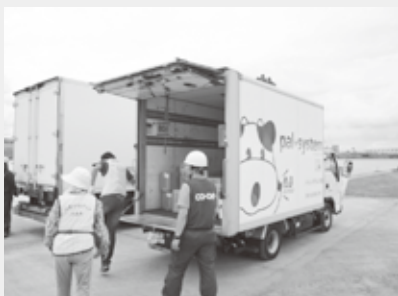
生活クラブ生協、パルシステム千葉は応急救援物資受入搬入訓練に参加