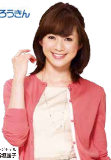
ろうきんイメージモデル 高垣麗子