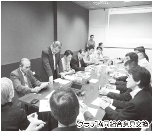
クラデ協同組合意見交換

生活を送るには働く場が必要であり、それはセラピーにも役立つはずだという考えからです。そして現在ではカタルーニャ州の10%が会員となるまでに発展しました。