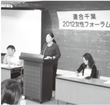
座長による分散会発表

去る9月15日(土)の午後、千葉県労働者福祉センターにおいて、67名(女性40名、男性27名)が参加し連合千葉女性フォーラムを開催しました。