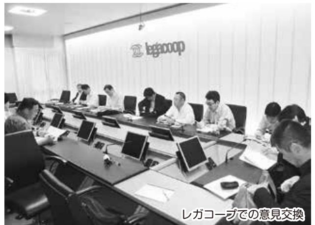
レガコープでの意見交換

最後に訪れたのはイタリア・ローマにある「legacoop (レガコープ・全国協同組合・共済組合連盟)」という労働者協同組合です。レガコープ