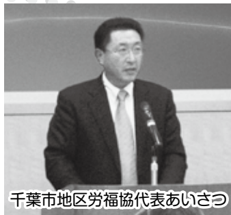
千葉市地区労福協代表あいさつ

ざしで聞き入っていました。 講演終了後の質疑では、相続の切実で具体的な質問から健康維持や認知症にならないためのアドバイスなどが出され、講師からの確かなお答えをいただきました。 今回の講座は、1回500円（4回でMAX1,500円）を参加費としていただきました。したが、アンケート結果では安い・妥当との評価をいただきました。今後の講座やセミナーのテーマ検討と合わせて参加費のあり方も考えていきます。 今後も、ワーカーズコープちばの皆さんはじめ、NPO団体の皆さんとも出前セミナー開催に向けて検討をしていきますので、ぜひ参加をお願いします。