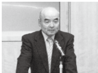
主催者を代表して 労福協会長あいさつ