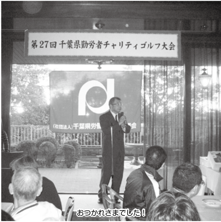
おつかれさまでした!