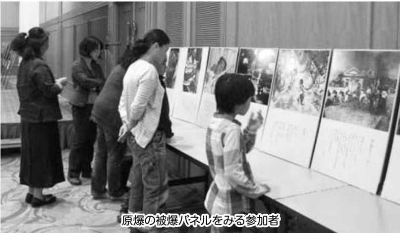
原爆の被爆パネルをみる参加者