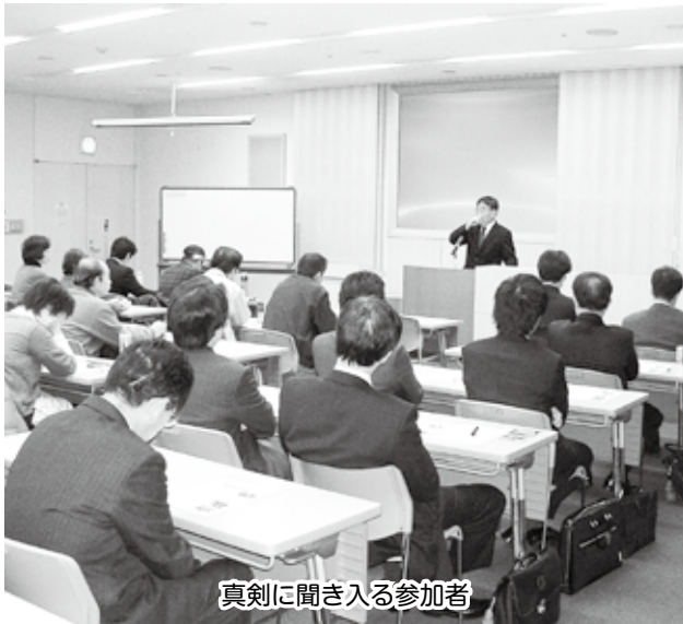
真剣に聞き入る参加者

団塊の世代をはじめとして、いざ定年を迎えるときになって「はて？これから何をどうすれば…」とあわてる方は意外と多いものです。そうならないために、千葉県労働者福祉協議会・千葉市地区労働者福祉協議会とワーカーズコープちばが共催し、セカンドライフを応援する連続講座「今からはじめる老い支度」と題して、10月13日・27日、11月10日・24日の4日間開催し、それぞれ40名を超える方々に参加いただきました。 講演内容は、健康・認知症・生活設計・相続・遺言・葬儀・お墓など、気にはなるけど普段なかなか聞く機会の少ないテーマでもあり、30歳台〜70歳台までと幅広い参加者の皆さんでしたが、それぞれの立場で真剣なまな