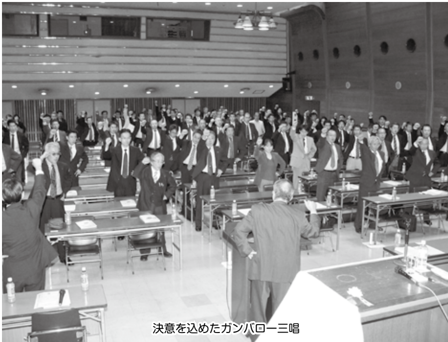
決意を込めたガンバロー三唱