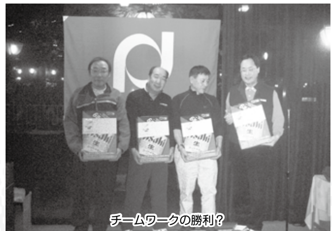
チームワークの勝利?